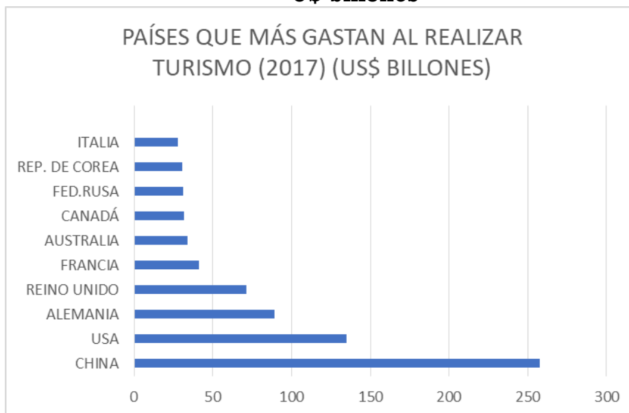
Gráfico N°2: Los 10 países que más gastan por individuos expresados en U$ billones